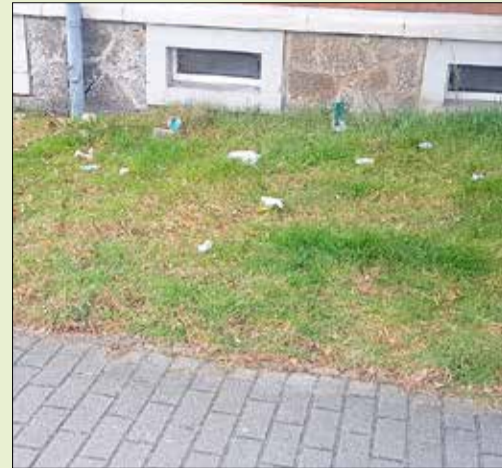
An der Macherstraße: Vorher

Mittlerweile sprießt das Grün überall in Kamenz und alle sind froh, von den ersten warmen Sonnenstrahlen zu profitieren. Vor gut einem Monat sah die Welt noch anders aus: tristes Alltagsgrau prägte die Gemüter und so manche Ecke in Kamenz brauchte dringend einen Frühjahrsputz.