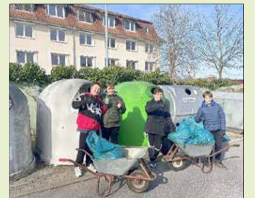
Team Seelig sorgt für Ordnung u. Sauberkeit

Insgesamt wäre es erfreulich, wenn jeder selbst auf Sauberkeit achtet und mit Zivilcourage für eine gepflegte Stadt eintritt. Und das betrifft nicht nur auffälligen Müll, sondern auch die Zigarettenstummel, die oft klein und unbemerkt überall am Wegrand liegend. Zigarettenfilter machen einen beachtlichen Anteil des Gesamtmülls aus. Bei Regen oder durch Wind wird dieser Müll häufig in die Natur, Gewässer oder Kanalisation gespült, wo er großen Schaden anrichtet. Auffällig sind auch die Zigarettenreste an Kamenzener Straßenrändern, an Spielplätzen und zahlreichen anderen öffentlichen Plätzen. Hiermit möchten wir an alle Raucher*innen appellieren, dies zukünftig zu vermeiden.