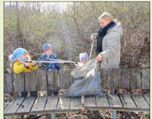
Kinder und Erzieherinnen vom Sonnenschein in Aktion

Die Resonanz war zwar überschaubar, aber immerhin konnten drei Tonnen Müll gesammelt werden, der wieder an bestimmten Sammelpunkten abzugeben war. In Kooperation mit der Naturzentrale und dem Abfallamt Bautzen wurden Handschuhe und Müllsäcke bereitgestellt. Hier musste aufgrund der doch sehr hohen Anzahl von Schülern kurzfristig nachgebessert werden. Die Lessing-Apotheke sprang dankenswerterweise mit einer Express-Nachlieferung mit Handschuhen ein.