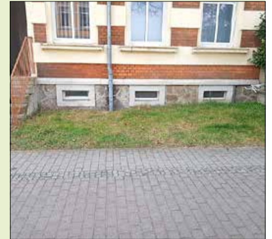
An der Macherstraße: Nachher

Auf Initiative des städtischen Citymanagements und in Kooperation mit der Stadtverwaltung und den kommunalen Diensten der Stadt Kamenz (KDK GmbH) startete eine weitere Auflage „Kamenz putz. Mehr Insekten – weniger Müll“ am 17. und 18.3.2023. Da im letzten Jahr die Resonanz beachtlich war, wurden insbesondere die bekannten Akteure beim diesjährigen Aufruf direkt angesprochen, einschließlich eines Aufrufes in den Schulen und Kindereinrichtungen.