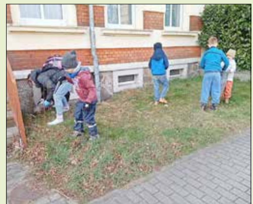
Schule mit Förderschwerpunkt Lernen u. soziale Entwicklung Kamenz: Schüler machen mit für ein saubres Kamenz

Insgesamt zeigte sich die Stadt – pünktlich zum Frühlingsstart, nämlich zum Einkaufssonntag mit dem Kamenzener Würstchen- und Regionalmarkt am 26.3.2023 – frisch und aufgeräumt. Wenngleich, und das gehört leider auch zur Wahrheit, insbesondere der Spielplatz an der Kita „Sonnenschein“ sein Ziel leider sehr schnell verfehlt hat. Dort zeigt sich nach ein paar Tagen wieder, dass einige Bürger nicht verstanden haben, was Wertschätzung bedeutet, sehr zum Ärgernis der Akteure, die dort fleißig zugange waren.