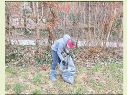
Auch Privatpersonen beteiligten sich an der Putzaktion

Insgesamt zeigte sich die Stadt – pünktlich zum Frühlingsstart, nämlich zum Einkaufssonntag mit dem Kamenzener Würstchen- und Regionalmarkt am 26.3.2023 – frisch und aufgeräumt. Wenngleich, und das gehört leider auch zur Wahrheit, insbesondere der Spielplatz an der Kita „Sonnenschein“ sein Ziel leider sehr schnell verfehlt hat. Dort zeigt sich nach ein paar Tagen wieder, dass einige Bürger nicht verstanden haben, was Wertschätzung bedeutet, sehr zum Ärgernis der Akteure, die dort fleißig zugange waren.