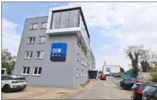
Ein Unternehmen, das seinen Wurzeln treu bleibt – der sanierte Firmensitz in Kamenz an der Nordstraße

Es waren bewegende Momente, denn man kann sich vorstellen, wie schwer es fällt, das eigene Lebenswerk, in das man viel Kraft und Zeit investiert hat, jemanden, sei er auch aus der eigenen Familie, was natürlich manches leichter macht, zu überantworten. Um es aber gleich vorwegzunehmen. Es ist die richtige Entscheidung, zum richtigen Zeitpunkt und in die richtigen Hände. Dies wurde auch in den an diesem Tag gehaltenen Reden und Grußworten deutlich.