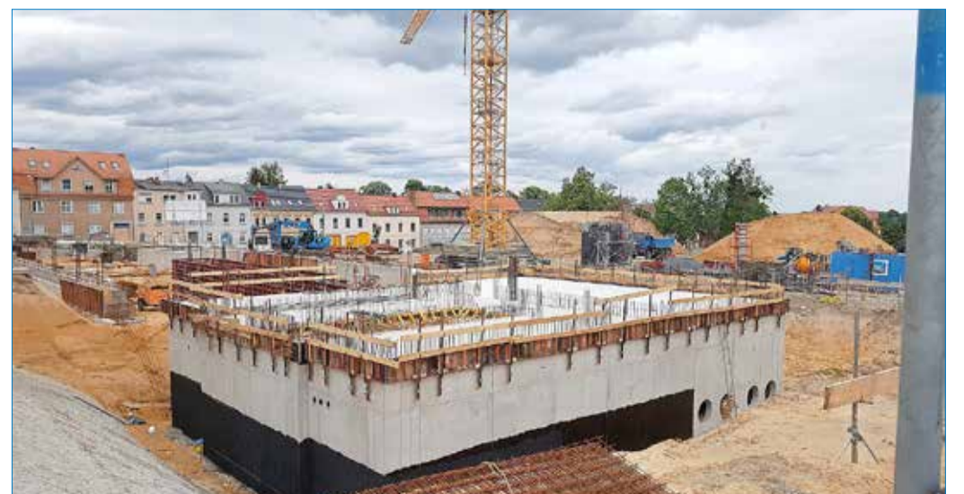
Deutlicher Baufortschritt des Erweiterungsbaus an der Lessingschule an der Henselstraße am 7. Juni 2020.