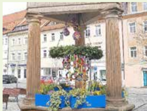
Osterschmuck am Andreasbrunnen (Stadtwerkstatt)