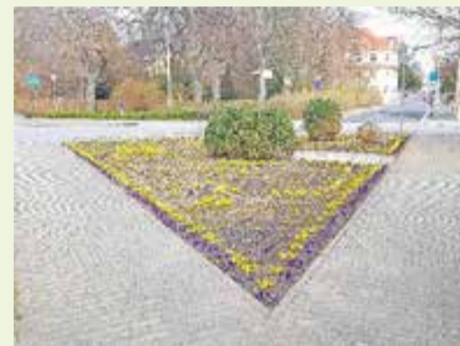
Fleißige Hände am Robert-Koch-Platz (Stadtgärtnerei)