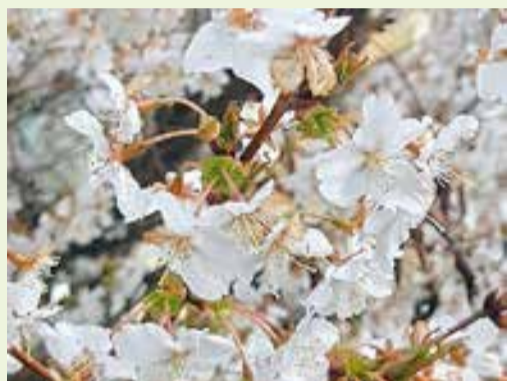
Die Natur von ihrer schönen Seite