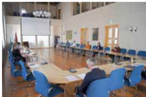
Regelmäßige Tagung des Krisenstabes im Ratssaal

Wir alle kennen Menschen in unserem Umkreis, die zu der ein oder anderen Art von Risikogruppen gehören und denen wir verbunden sind. Und deshalb bedarf es der gemeinsamen Anstrengung, für eine gewisse Zeit auf normale und liebgeordnete Gewohnheiten und Handlungen zu verzichten. Wir tun das nicht nur für die anderen, wir tun es auch für uns!