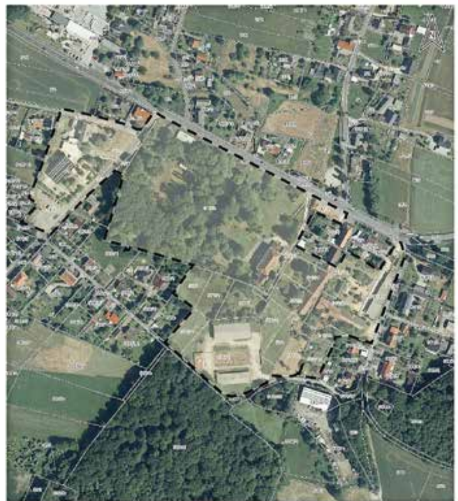
Geltungsbereich des Bauleitverfahrens