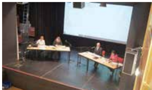
Bei der Sitzung des Kamenzer Stadtrates am 01.04.2020 waren die Vertreter der Verwaltung und der Oberbürgermeister auf der Bühne des Stadttheaters platziert.

Stadtrat und Stadtverwaltung reagieren auf die neue Situation. Die Verwaltung hat einen Krisenstab gegründet, der in regelmäßigen Abständen tagt, um jeweils aktuell auf die sich tageweise ändernden Herausforderungen zu reagieren. Darüber hinaus sind die Mitarbeiterinnen für ihre Bürgerinnen und Bürger da und ansprechbar, auch wenn die persönliche Erreichbarkeit aus verständlichen Gründen sehr reduziert werden musste. Eine Kontaktaufnahme mit der Stadtverwaltung ist weiterhin telefonisch, digital oder per E-Mail möglich. Darüber hinaus wurden ein Corona-Sorgen-Telefon sowie eine Corona-E-Mail-Adresse eingerichtet, die schon jetzt gut Dienst geleistet haben.