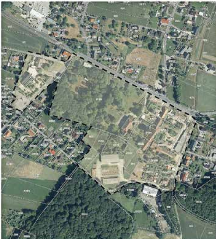
Geltungsbereich des Bauleitverfahrens