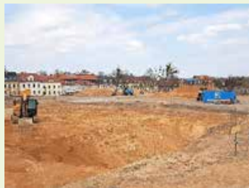
Es geht voran - Baustelle Lessingplatz