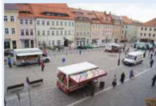
Auf dem Kamenzer Marktplatz am 02.04.2020

Wie bekannt, ist durch die geltenden Allgemeinverfügungen und deren Auslegungsregelungen die Durchführung von Wochen-/FriscHEmärkten untersagt. Diese Entscheidung ist richtig und nachvollziehbar, um einen sogenannten „hot-spot“ der Ansteckungsmöglichkeiten aufgrund der Ansammlung von Menschengruppen auf engen Platzverhältnissen zu beseitigen. Trotzdem bleibt natürlich die Frage nach der Versorgung, besonders der Innenstadt, aber auch nach dem wirtschaftlichen Überleben der mobilen Einzelhändler bestehen. Insofern findet kein Markt statt, sondern zeitlich und räumlich entzerrt werden Einzelhändler, die der Versorgung der Bevölkerung mit Lebensmitteln dienen, auf dem Marktplatz stehen. Damit ist gewährleistet, dass genügend Abstände zwischen den Einzelhändlern vorhanden sind, so dass auch der geforderte Abstand von mindestens 1,5 Metern – wie beim Anstehen an der Kasse im Supermarkt – gegeben ist.