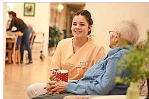
Hier fühlen sich die Bewohner und Mitarbeiter wohl. Ein offenes Ohr und ein liebevoller Umgang sind ein wichtiger Standard im Malteserstift St. Hedwig in Bautzen.

Weitere Informationen: www.gruener-haken.de