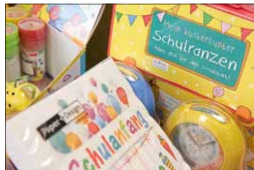
Der Schuleingang steht bevor!

Gerade jetzt zum bevorstehenden Schulanfang oder Schuleingang, steht die Tür bei Schütze nicht lange still. Zuckertüten, Füller, Schreibhefte, Scheren, Radiergummis und vieles mehr kann im Geschäft auf der Bautzner Straße 2 erworben werden. Wochentags von 9 – 18 Uhr und sonnabends von 9 – 12 Uhr können Sie bei Schütze reinschauen.