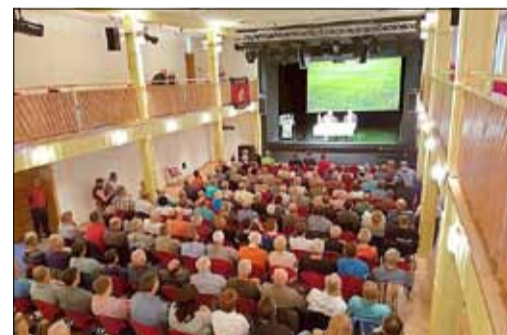
Nahezu vollständig besetzt: der Theatersaal zum Fußball-Talk